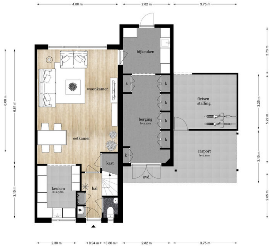
Gildestraat 109 - Gendt Begane Grond

De plattegronden zijn geproduceerd voor promotionele doeleinden en ter indicatie. Aan de plattegronden kunnen geen rechten worden ontleend.